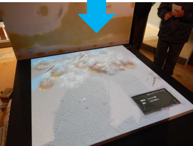
空襲被爆範囲ジオラマ（その2） ジオラマの上にあるプロジェクターから 空襲の模様を映像で再現