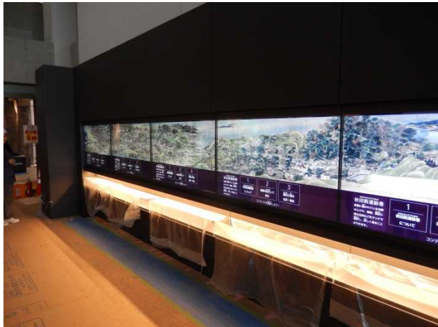
江戸時代、土崎港の繁栄を描いた秋田街道絵巻絵巻を実寸大で再現展示したタッチモニター

土崎みなと歴史伝承館を中心に、土崎のまちづくりに関する話題をお届けする「土崎まちづくりかわら版」。いよいよ展示工事も大詰めを迎えました。今回は、工事の進捗状況などをお知らせします。