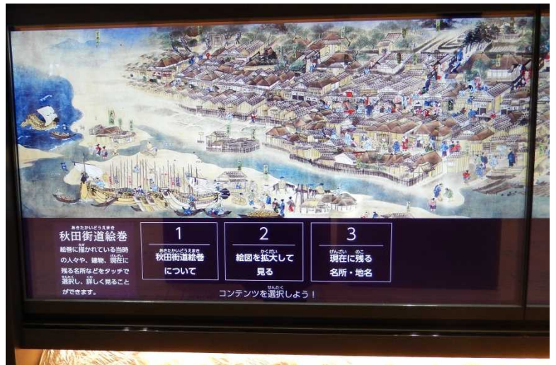
左写真を拡大したもの。今も残る主な史跡・名所にタッチすると、現在の写真や解説を表示