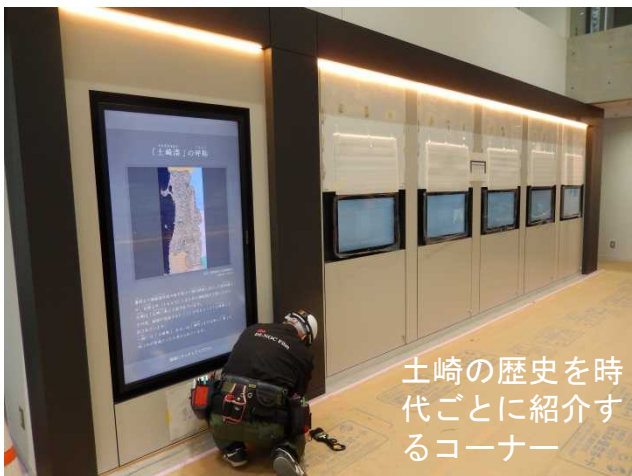
土崎の歴史を時代ごとに紹介するコーナー