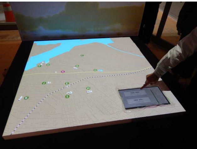
空襲被爆範囲ジオラマ（その1） 土崎の街並みをジオラマで製作