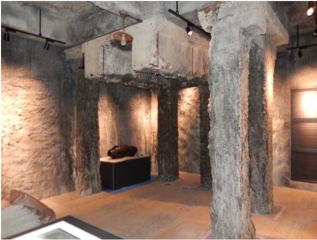
空襲展示ホール 柱と梁の一部は被爆倉庫から移設