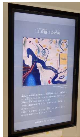
左写真を拡大したものの全体の概要のほか、古代、中世、近世、近・現代の時代ごとにタッチモニターを設置