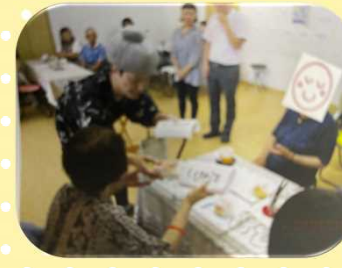
⑤カフェとも・旭川