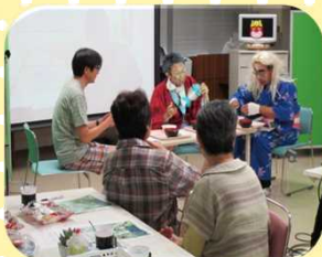
⑧ほほえみサロン おのぼ