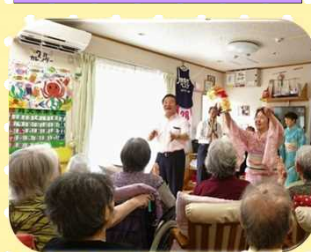
⑩グループホーム うららか