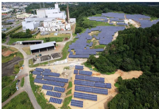
太陽光発電施設(総合環境センター)

「再生可能エネルギー」を利用した発電は7.3%にとどまっていますが、将来的に送配電網の整備等の課題を解決しながら再生エネ由来の電気を増産していくことが、地球温暖化にブレーキをかける最も効果的な方策の一つとされています。