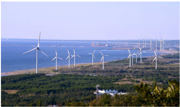
林立する風力発電機(雄物川河口周辺)