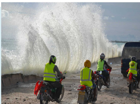
高潮の被害が大きいキリバスの海岸沿いの道路

個々人でも、例えば、▼買物へのマイバッグ持参▼節電▼省エネ家電への買い換え▼エコドライブ▼ペレットストーブの購入▼公共交通機関の利用▼車買い換え時のハイブリッド車や電気自動車等の選択▼など、日々の生活の中で地球温暖化防止に貢献できることはたくさんあります。