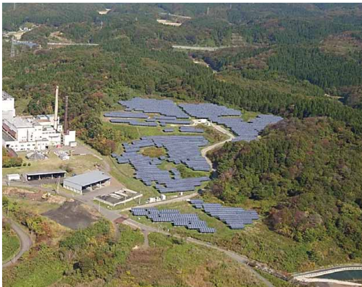
メガソーラー（秋田市総合環境センター）