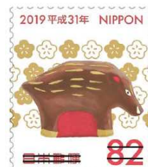
いのしし 八橋人形の「亥」がデザインされた平成31年の年賀切手