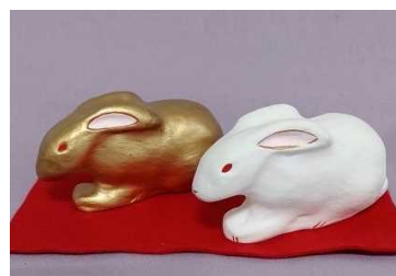
えと うさぎ 来年の干支の「卯」の八橋人形