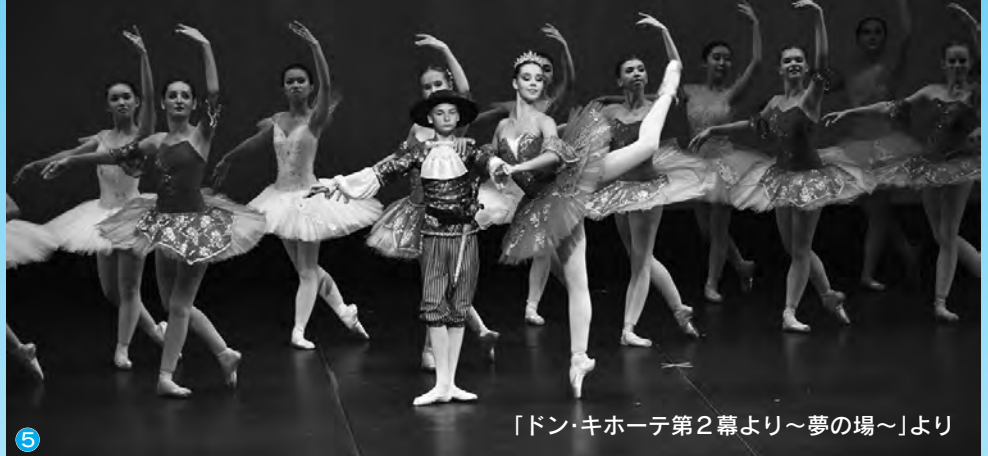
「ドン・キホーテ第2幕より～夢の場～」より