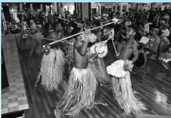
アルヴェで開催した「フィジー共和国文化交流フェスタ」で、伝統の踊りを披露しました

★ラグビーワールドカップ常連国のフィジー共和国。市では、平成28年12月に政府から登録されたホストタウン交流計画に基づき、同国ラグビー代表チームの事前合宿誘致を進めています。昨年は、秋田市訪問団がフィジー共和国を訪れ交流を深めました。