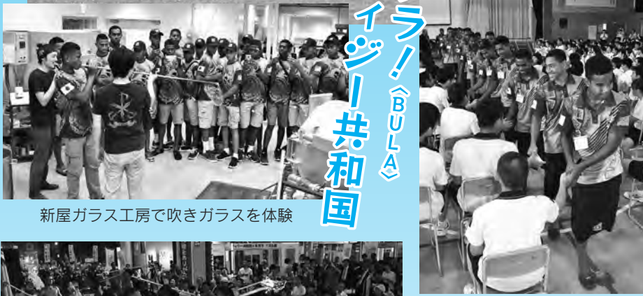
新屋ガラス工房で吹きガラスを体験