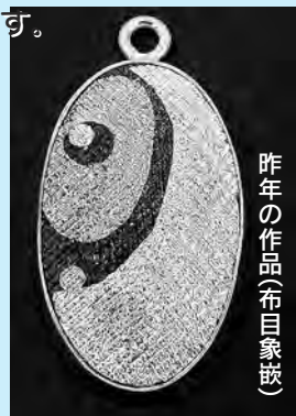
昨年の作品(布目象嵌)