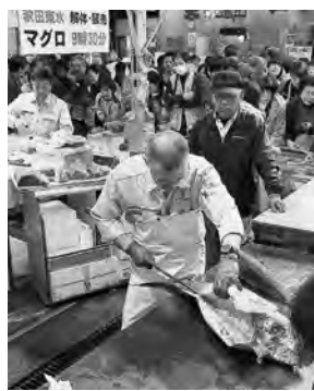
見事な包丁さばき！

北前船がルーツとされる踊りなどが披露されました。大正寺おけさ(左上)、相染町青年会演芸部(上)、土崎港伝統芸能伝承会のみなさん(左)