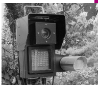
監視カメラ「みてるくん」

不法投棄により検挙された場合、5年以下の懲役もしくは1千万円以下の罰金、またはこれらの併科(同時に二つ)に処せられます。