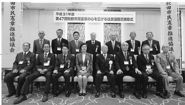
平成31年度 第47回秋田市民憲章の心を広げる住民活動賞表彰式