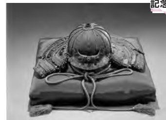
白韋威十二間阿古陀形筋兜 しろかわおしじゅうにけんあごたなりすじかぶと