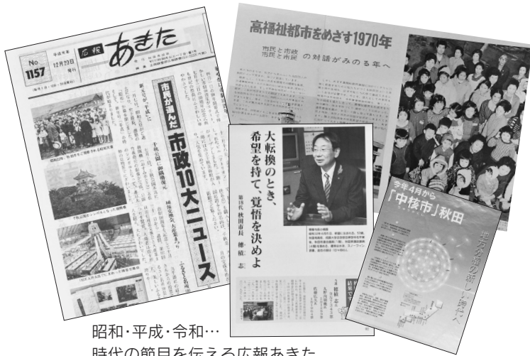
昭和・平成・令和…時代の節目を伝える広報あきた