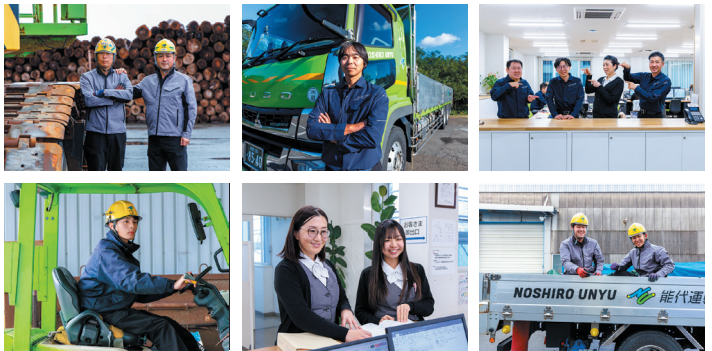
<貨物自動車運送事業>

あなたの輝く場所がきっとある THERE'S SURELY A PLACE WHERE YOU'LL SHINE