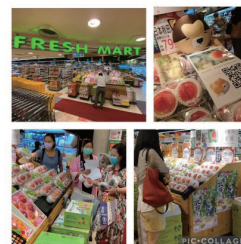
台湾へ「かづの北限の桃」を輸出販売した際の様子

また、2023年度より台湾輸入業者を定期的に招いて秋田牛や県産農作物の産地視察を実施しているほか、台湾への県産品の輸出による新たな販路の開拓や産品の拡大を支援しています。