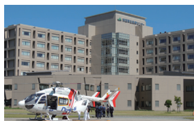
秋田厚生医療センター

秋田県全域に広がる厚生連病院ネットワークで、地域の皆様の健やかな暮らしを支えています。 県内すべての医療圏に9病院を配置し、地域の皆様の健康を守るべく総合的な医療を展開しており、それぞれが基幹病院として位置付けられています。