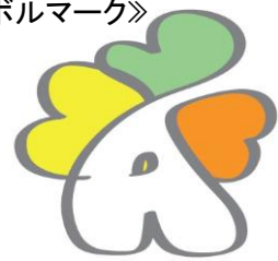
エイジフレンドリーシティあきた