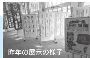
昨年の展示の様子