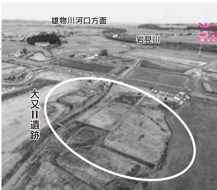
発掘現場周辺の空撮