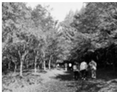
今や紅葉スポットの定番、旭川ダム公園の彩りも真っ盛りでした