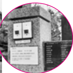
演奏9曲、唄11曲がそれぞれ続けて流れます