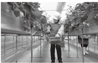
いちご栽培のビニールハウス

選出理由：法人設立以来取り組んできた水稲、大豆、枝豆などの栽培に加え、年間を通じて収穫を行う周年出荷体系の確立によるさらなる経営の発展をめざし、令和2年度から秋田市で初となる施設でのいちご栽培を開始するなど、「攻めの農業」を実践する、秋田市を代表するモデル的な経営体であること。