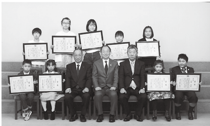
絵画コンクールで入賞したみなさん (2月9日、ANAクラウンプラザホテル秋田で)