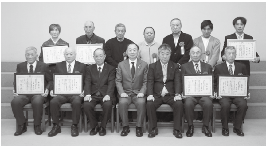
農業大賞の表彰式に出席したみなさん (2月9日、ANAクラウンプラザホテル秋田で)