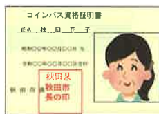
コインバス資格証明書