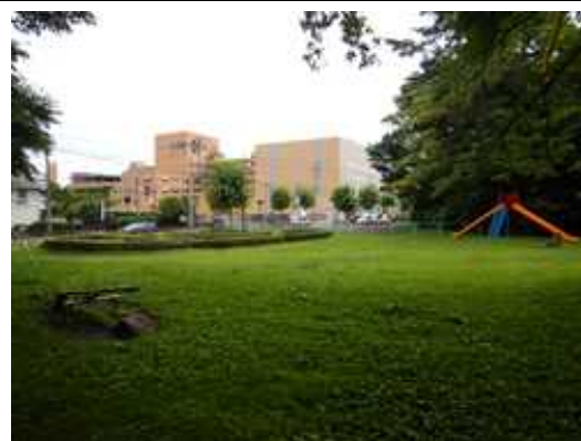
図2 整備予定地（公園側から）