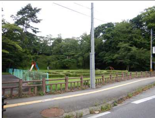
図1 整備予定地（県道側から）