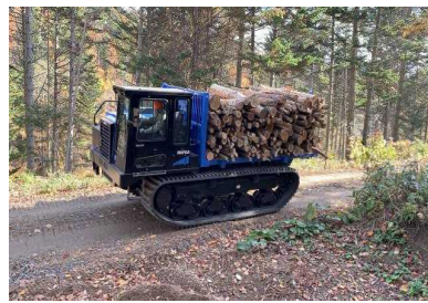
フォワーダ (積込み・運搬)