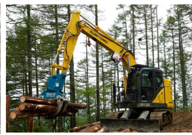
グラップル (集材・積込み)