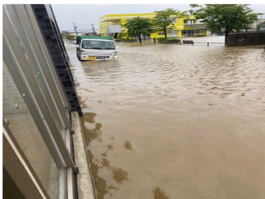
施設周辺（公用車の浸水）