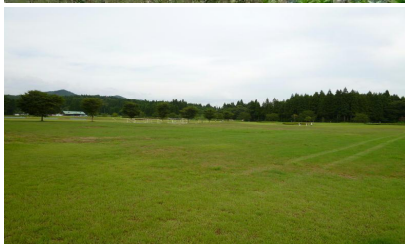
写真：左上 サッカー場 左下 多目的広場 右上 グラウンドゴルフ場