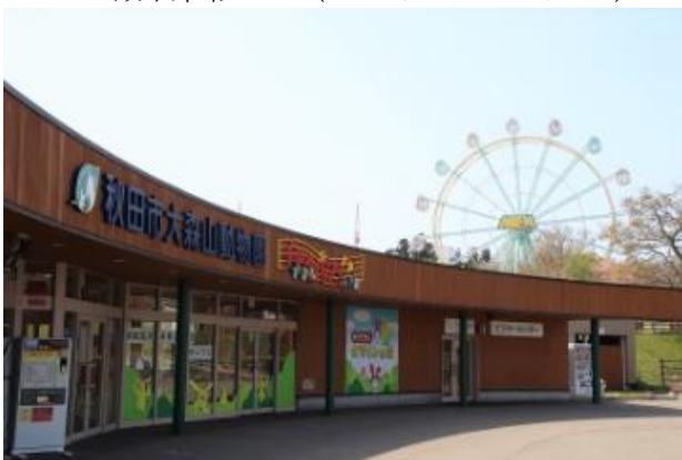
動物園入口 (ビジターセンター)