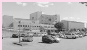
勤労者総合福祉センター