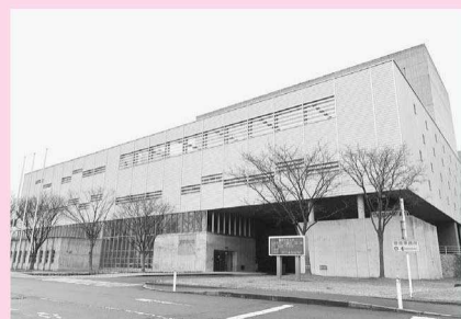
総合環境センター

この手数料と同額の「手数料相当額」は、条例で使い道が定められており、ごみ減量やさまざまな環境対策に活用することになっています。次の世代の負担を減らし、私たちの美しい環境を未来に引き継ぐため、今後ともご協力をお願いします。