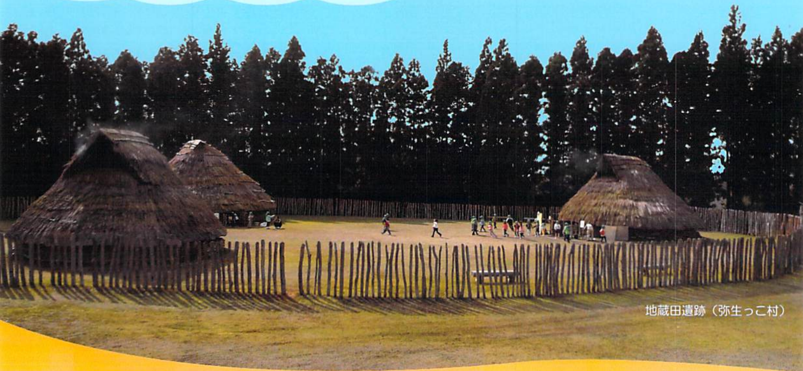
地蔵田遺跡（弥生っこ村）

全国で初めて、木柵で囲まれた弥生時代前期（2,200年前）のムラが発見された遺跡です。