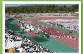
秋田わか杉国体開会式