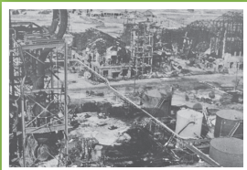
8月14日、終戦前夜の土崎空襲