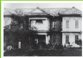
土手長町中丁にあった初代庁舎