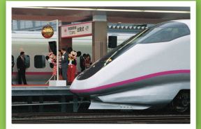
秋田新幹線こまち