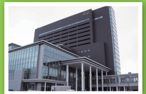
秋田拠点センターアルヴェ