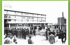
現在の市庁舎落成式