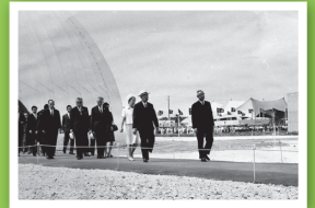
農業博覧会と昭和天皇