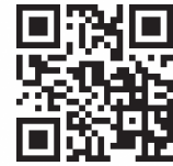
母子健康手帳 情報支援サイト

「母子健康手帳」は、妊娠中～18歳までの健康に関する情報が1つの手帳で管理できるものです。妊産婦健康診査や乳幼児健康診査、予防接種、育児に関する教室に参加する時などに使用するの、持ち歩くようにしましょう。また、妊娠や子育てに関する知識や情報が記載されているほか、ママがその時に感じた気持ちなどを記載することもできます。有効に活用しましょう。