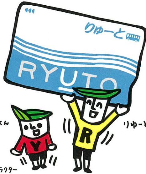
新潟交通 ICカードキャラクター