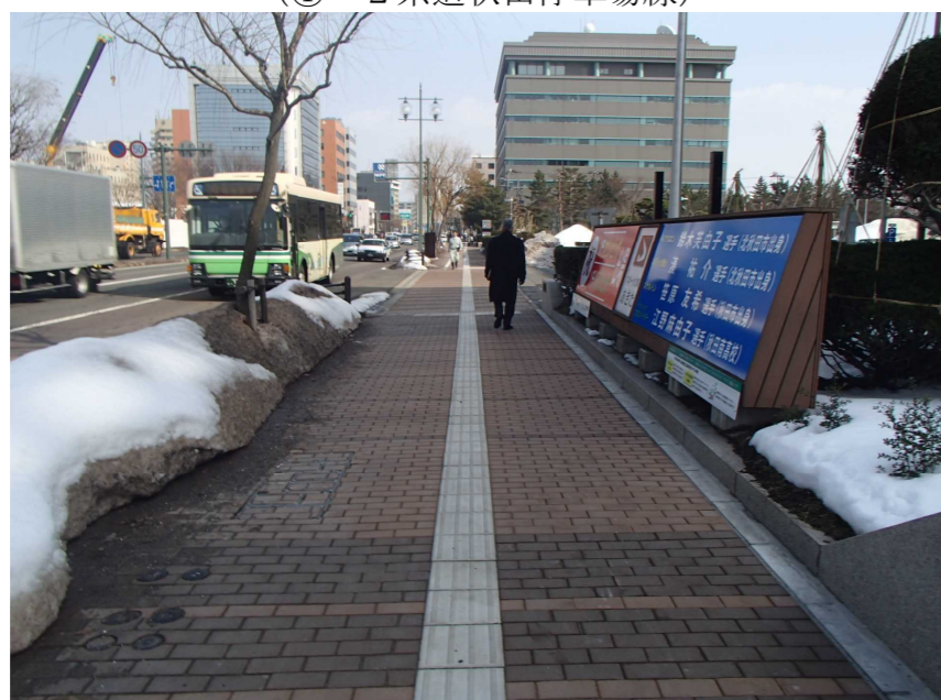
歩道の消融雪設備の更新 (①-2 県道秋田停車場線)