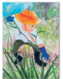
令和4年度 最優秀賞作品