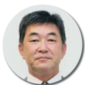
5-1 石井 健 雄和女米木ほか