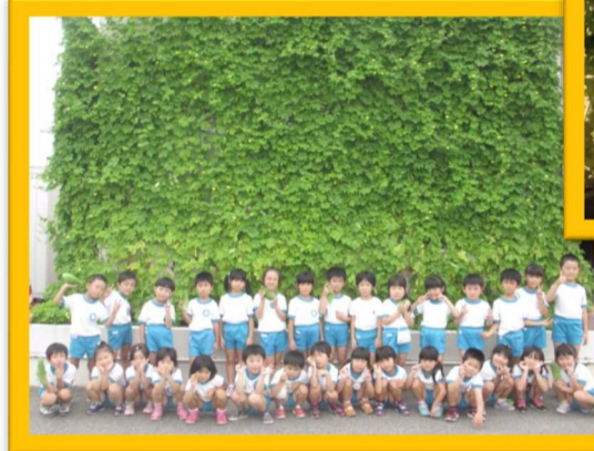
最優秀賞(団体部門)