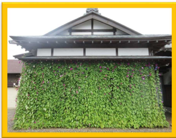
最優秀賞(個人部門)

平成30年度の表彰作品です。 今年度も「個人部門」と「団体部門」に分けて審査・表彰いたします。