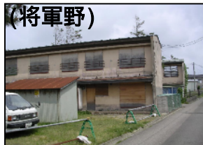
(将軍野) 構造：簡耐2階建 建設年度：S30~31 管理戸数：16戸