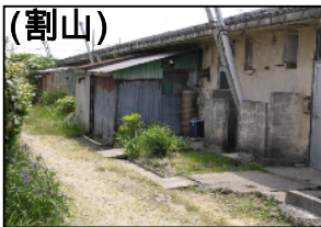
(割山) 構造：簡耐平屋建 建設年度：S32~33 管理戸数：40戸