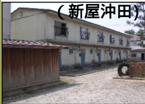
(新屋沖田) 1 構造：簡耐平屋建 建設年度：S52 管理戸数：12戸 2 構造：RC3階建 建設年度：S43 管理戸数：24戸