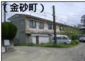
(金砂町) 構造：簡耐2階建 建設年度：S29 管理戸数：12戸