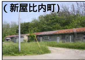
(新屋比内町) 構造：簡耐平屋建 建設年度：S37~39 管理戸数：174戸

昭和20~30年代に建設した住宅もあるなど老朽化が著しい 居住水準の面及び保安上、景観上から早急に建替えを行う必要がある