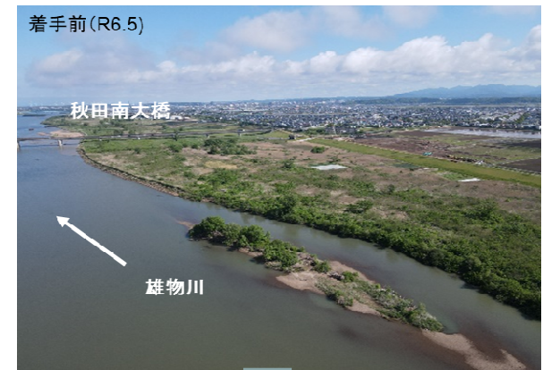
雄物川右岸(秋田南大橋付近)河道掘削状況写真