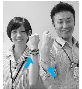
腕に付けたのが オレンジリング

認知症を正しく理解し、認知症の人やその家族を応援する「認知症サポーター」になりませんか。受講後は、認知症サポーターの証である「オレンジリング」を差し上げます。