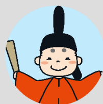
秋田城イメージキャラクター 「秋麻呂くん」

■ 秋田城跡歴史資料館 (秋田市寺内焼山9番6号) TEL 018-845-1837 FAX 018-845-1318 MAIL ro-edac@city.akita.lg.jp