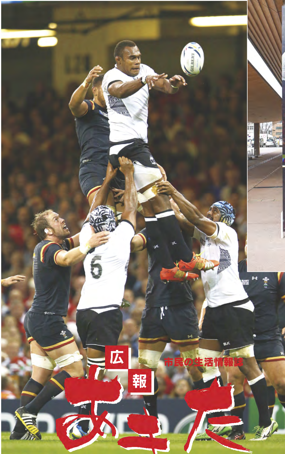
(写真提供…在日フィジー共和国大使館/白のジャージがフィジー共和国)