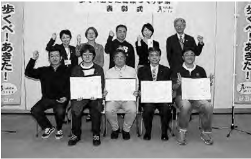
上の写真は働く世代の部の表彰式(3月20日)、下はシニアの部の修了式(1月18日)