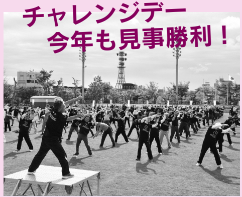
オープニングのラジオ体操は大盛況！

性別、年齢、職業、身体状況などに関わりなく、一人一人が個性や能力を十分に発揮できる「多様性を認め合う社会」をつくるため、まずは職場や学校、家庭などでお互いが気持ちよく過ごせるように、身近な人と話してみませんか。 【問】生活総務課女性活躍推進担当 ☎0888(56550)