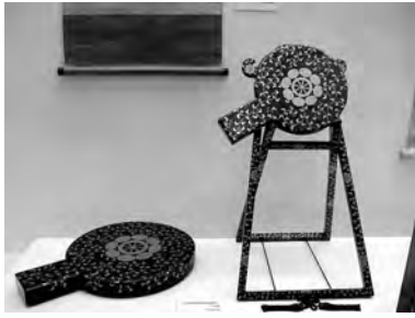
八ツ水車紋唐草時絵鏡箱・鏡立

日時 8月31日(土) 9:00 11月24日(日) 16:30 会場 佐竹史料館 ☎(832)7892 観覧料 100円(高校生以下無料)