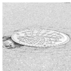
マンホール周囲の舗装破損