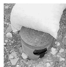
公共汚水ますの破損