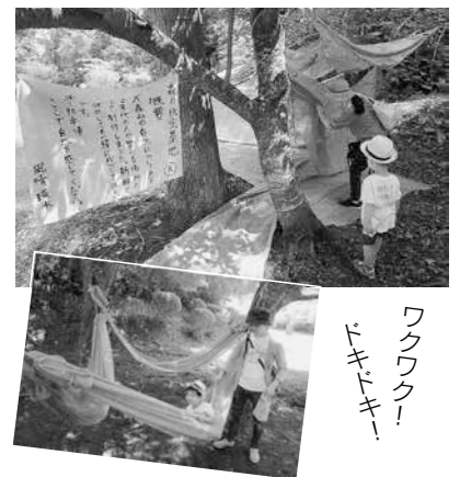
ワクワク！ドキドキ！