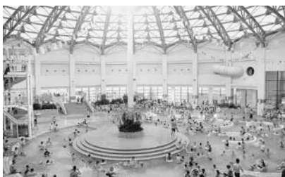
常夏リゾート気分！(写真は過去のもの)