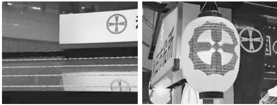
まつり本番での使用を想定し、屋台の装飾は環境に優しいLEDが屋根や提灯のあかりなどに使われています