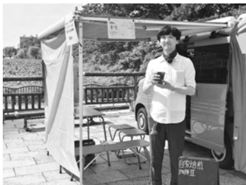
キッチンカーの営業は午前10時～午後4時の予定(お休みの日もあります)