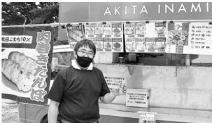
こちらのお店のおすすめ肉巻きたんぼ!