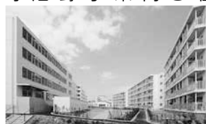
新屋比内町市営住宅