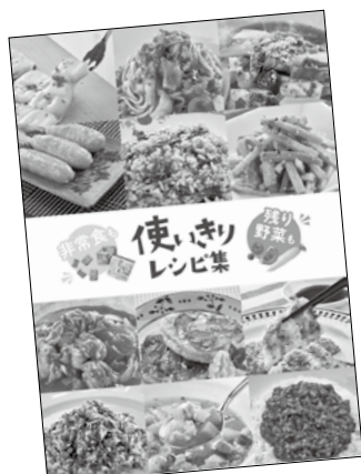
秋田市 使いきりレシピ集 検索