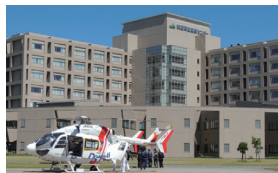
秋田厚生医療センター

県内すべての医療圏に9病院を配置し、地域の皆様の健康を守るべく総合的な医療を展開しており、それぞれが基幹病院として位置付けられています。