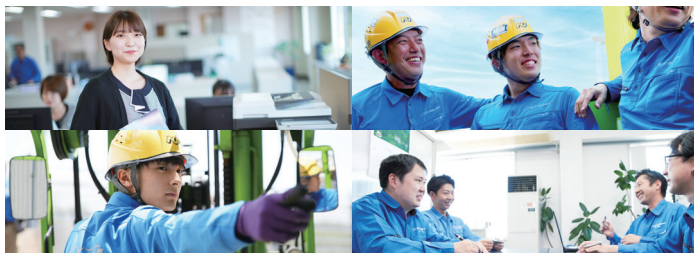
<貨物自動車運送事業>