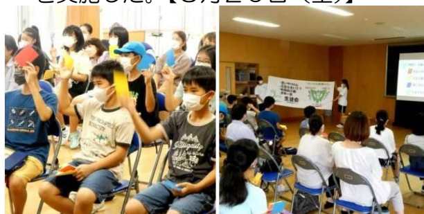
城東中ホームページより