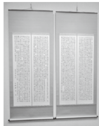
右は展示会出展時の様子。下は作品の一部を拡大