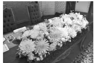
新郎・新婦の高砂はより華やかに

持ち寄られたモノや、招聘作家による作品の展示など、作品を鑑賞するだけの展覧会とはひと味ちがいで、思考を巡らせることでより楽しめる内容となりました。