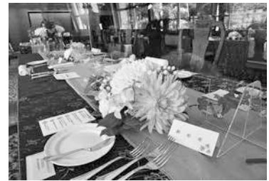
印象に残る披露宴を演出♪